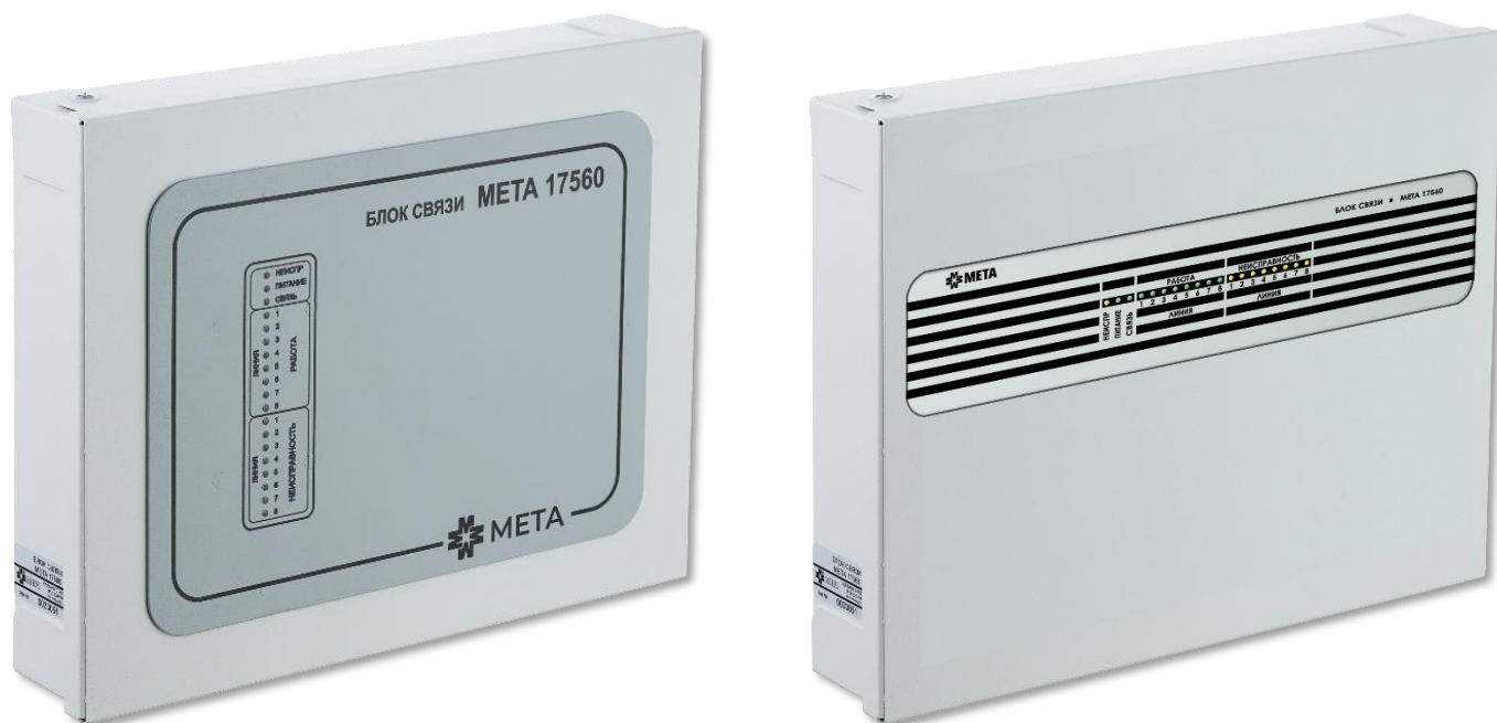
Рисунок 1. Внешний вид БС МЕТА 17560: ФКЕС 426491.576 – слева, ФКЕС 426491.636 – справа.

Примечание: «*» – до 300м при использовании кабеля UTP CAT 5E, до 600м при использовании кабелей типа КСБнг(А)-FRLS/FRHF Nx2x0,64, КИС-РВнг(А)-FRLS Nx2x0,64, КИС-РПнг(А)-FRHF Nx2x0,64 или кабелей для промышленного интерфейса RS-485 с аналогичными характеристиками.